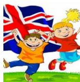
English for children 1-2-3

“Azioni di integrazione e potenziamento delle aree disciplinari di base”